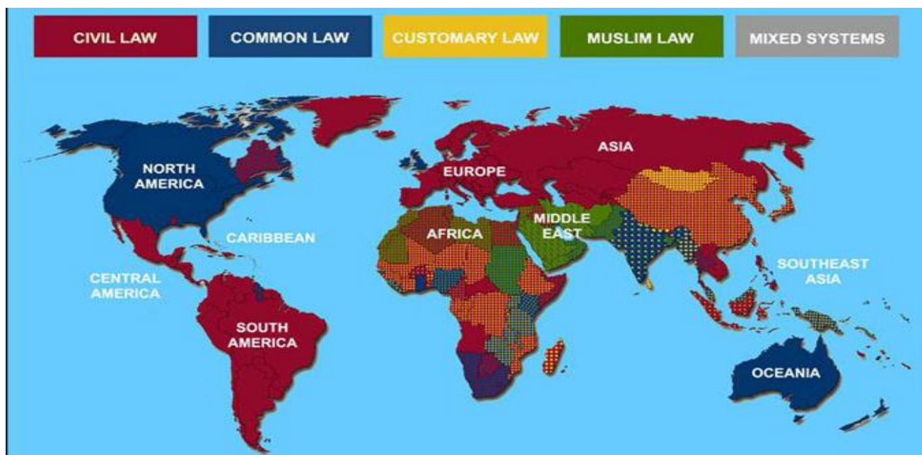
全球法律体系分布图

深入了解全球法律适用体系的分布与特点，对于中国企业出海而言，是至关重要的必修课，它不仅关乎企业合规运营，更直接影响着企业的战略布局与长远发展。因此，接下来我们将深入探寻全球法律适用体系的分布与特点，为企业出海绘制更为详尽的航海图，助力企业在国际商海中安全、稳健地航行，实现全球化战略目标。